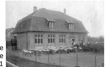
Unsere Schule ca. 1911

Regelmäßig finden Hei m a t a b e n d e statt, bei denen die Erforschung der Geschichte unseres Ortes im Mittelpunkt steht. Alte Dokumente, Postkarten, Landkarten werden studiert.