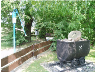
Der vom Verein hergerichtete und gepflegte Platz an der alten Pumpe

Der Verein „Glück-Auf Riehe“ gründete sich am 26. Januar 1899 unter dem Namen "Club Einigkeit macht stark" und ist somit nicht nur Riehes, sondern auch Suthfelds ältester Verein.