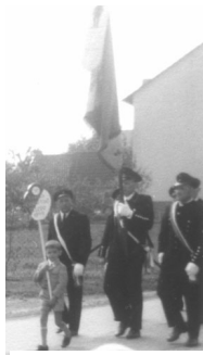
Beim Rundmarsch 1969

Die Heimatgeschichte ist ein zusätzlicher Schwerpunkt unserer Arbeit. Hierunter verstehen wir unter anderem die Pflege und Erhaltung bereits verschwundener historischer Stätten (Pumpe, Bians Weeihen, Flurnamenübersicht, Strutzbergstollen).